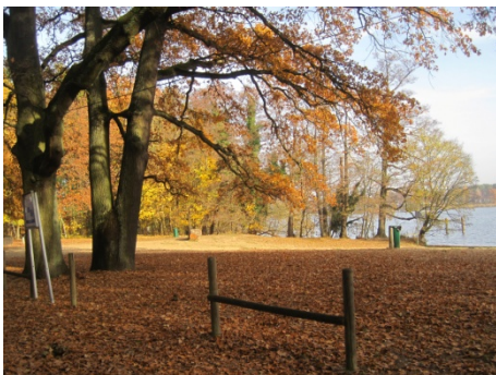
An der Bürgerablage