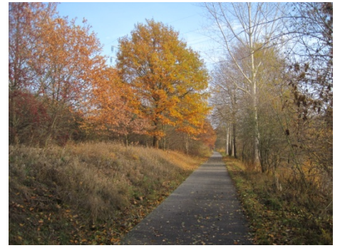
Der Havel-Radweg am Niederneuendorfer See