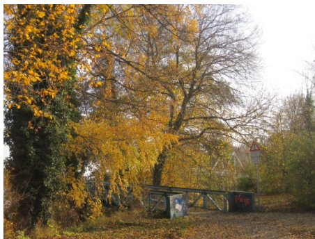
Die Blaue Brücke