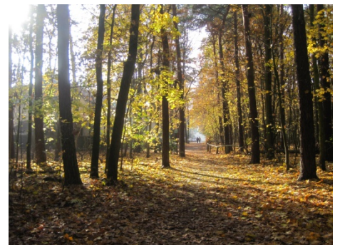
Vor dem Merianweg