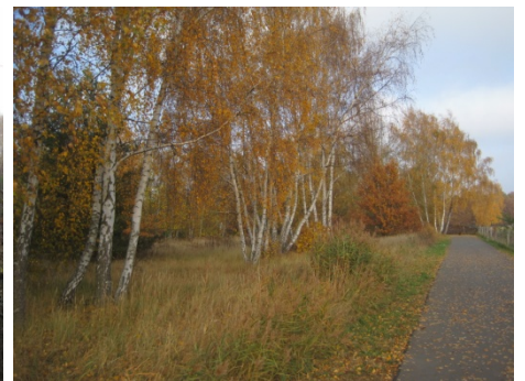
Radweg am Spekteesee