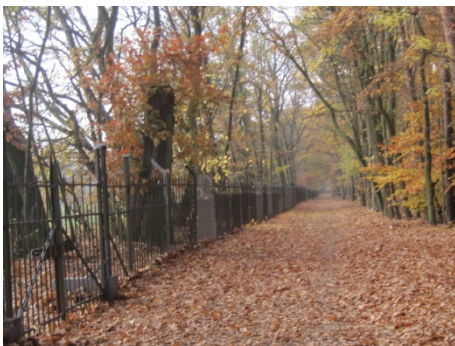
Am Ev. Johannesstift