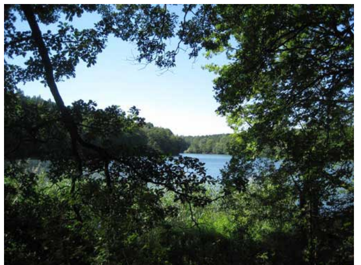
Die Krumme Lanke