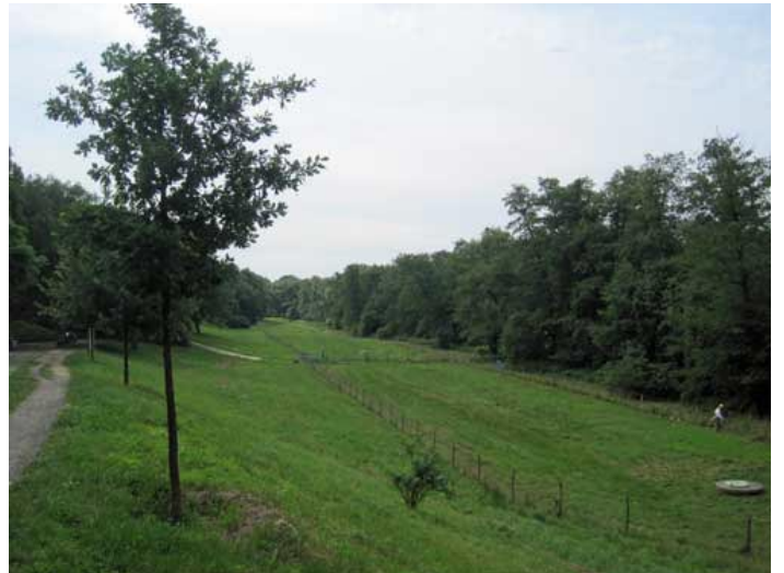
An der „Rehwiese“