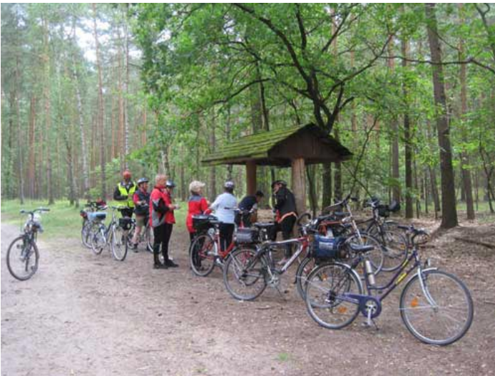
„Boxenstop“ im Düppeler Forst