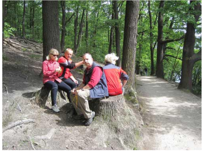
Pause am Schlachtensee