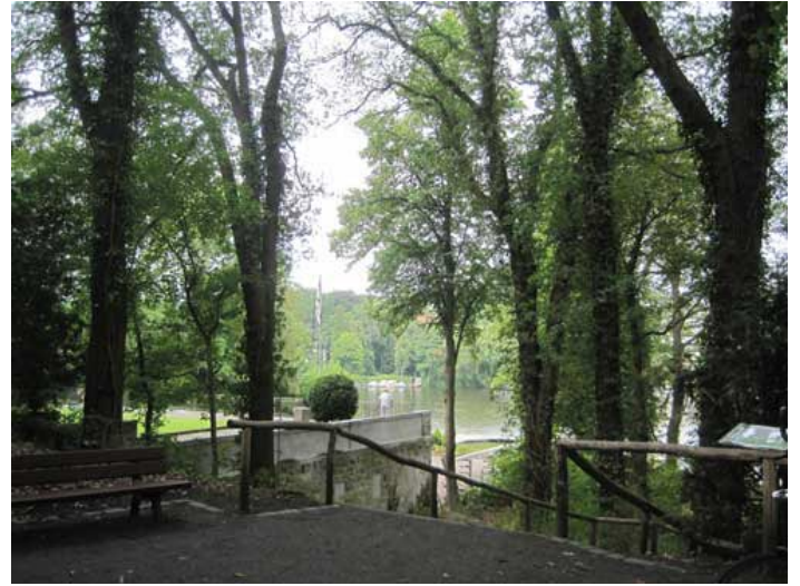
Kleist Grab/Am Kleinen Wannsee im Kleist-Jahr 2011