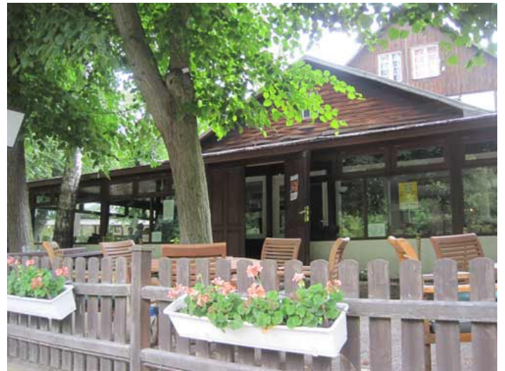
und Rast im Landhaus Söhnel/Loretta