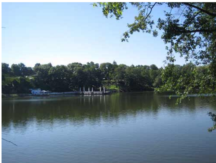
Der Halensee (unten)