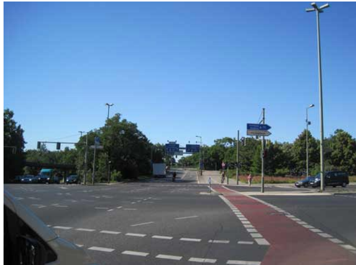
Funkturm und Messedamm (oben)